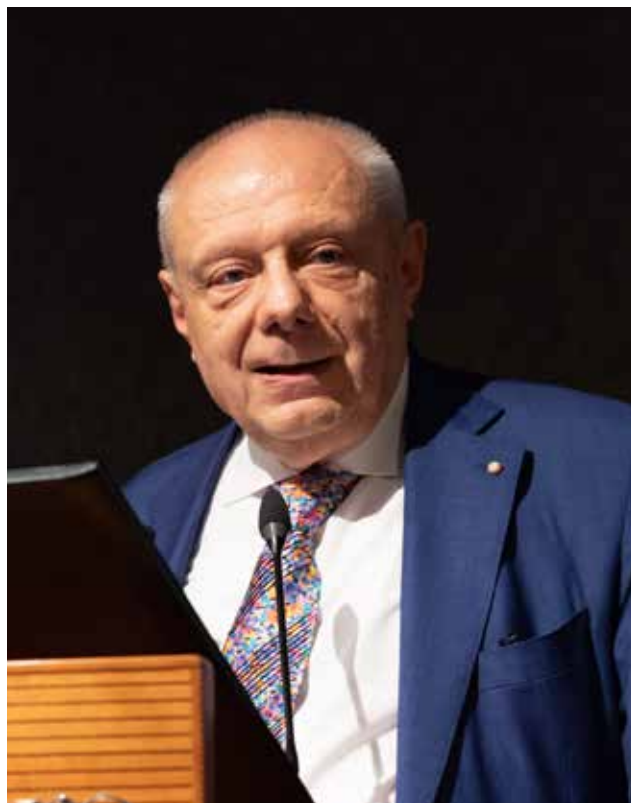
Il Presidente Nazionale Gianfranco Finzi

a) L'indicazione dei protocolli relativi alla disinfezio-